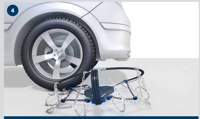
Demounting pewag servomatik