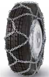
pewag austro super reinforced