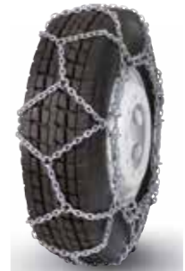
pewag austro super