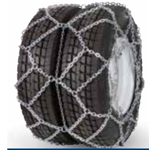
pewag austro super twin