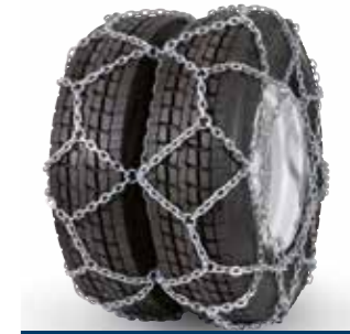
pewag austro super reinforced twin