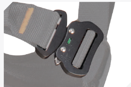
BOUCLES DE VERROUILLAGE AUTOMATIQUE EN ALUMINIUM AVEC TÉMOIN DE FERMETURE