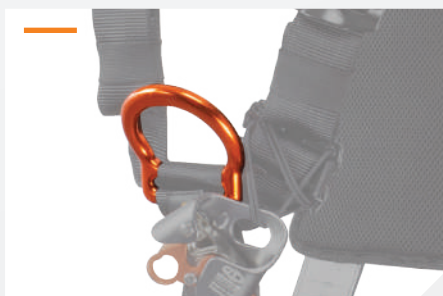
POINT D'ACCROCHAGE ANTICHUTE STERNAL PAR D ALUMINIUM