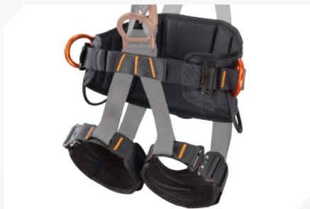
LARGES CUISSARDS ET CEINTURE DE MAINTIEN AVEC TISSU 3D RESPIRANT