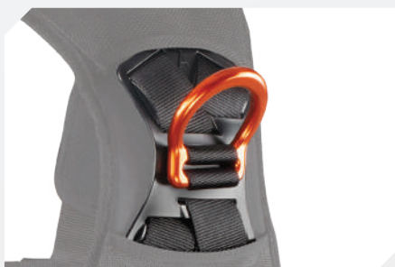
POINT D'ACCROCHAGE ANTICHUTE DORSAL PAR D ALUMINIUM