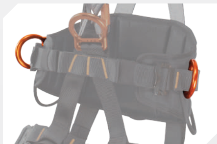
POINTS D'ACCROCHAGE LATÉRAL DE MAINTIEN AU TRAVAIL PAR D ALUMINIUM