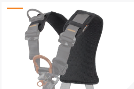
DOSSERET ÉPAULE AVEC TISSU 3D RESPIRANT