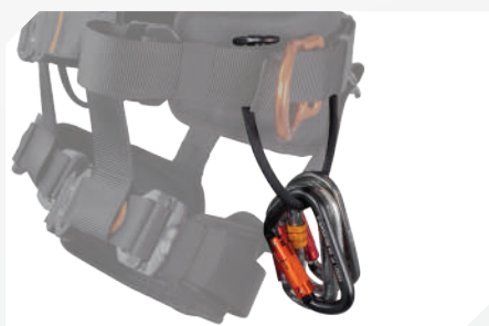
PORTE OUTILS (X2) + SANGLES CORDON PORTE OUTIL GRANDE CAPACITÉ (X3)