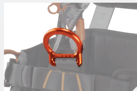
POINT D'ACCROCHAGE VENTRAL DE SUSPENSION PAR D ALUMINIUM