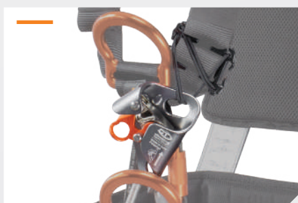
TENDEUR DE BLOQUEUR INCLUS RÉF. NUS131A + BLOQUEUR VENTRAL EN OPTION RÉF. NBLOCK