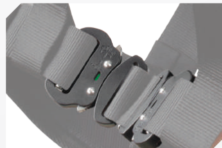
BOUCLES DEVERROUILLAGE AUTOMATIQUE ET ALUMINIUM AVEC TÉMOIN DE FERMETURE