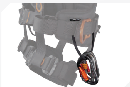
PORTE OUTILS (X2) + SANGLES CORDON PORTE OUTIL GRANDE CAPACITÉ (X3)