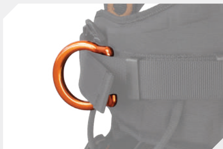
POINTS D'ACCROCHAGE LATÉRAL DE MAINTIEN AU TRAVAIL PAR DÉ ALUMINIUM PIVOTANT