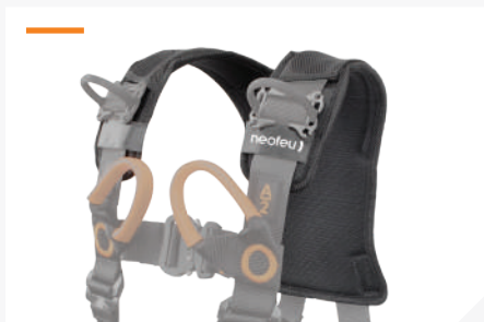
DOSSERET ÉPAULE AMOVIBLE AVEC TISSU 3D RESPIRANT