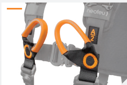
POINTS D'ACCROCHAGE ANTICHUTE STERNAL PAR BOUCLES À RELIER