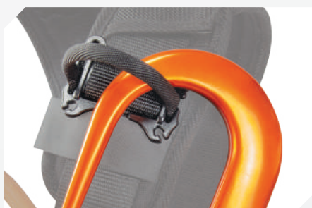
PORTE LONGE AMOVIBLE (X2)