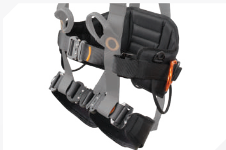
LARGE CUISSARD ET CEINTURE DE MAINTIEN AVEC TISSU 3D RESPIRANT