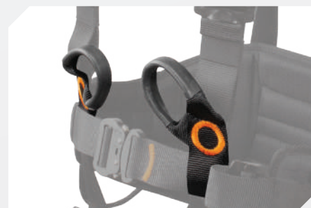
POINTS D'ACCROCHAGE VENTRAL DE MAINTIEN AU TRAVAIL PAR BOUCLES À RELIER