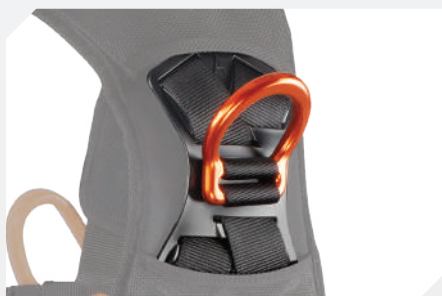
POINT D'ACCROCHAGE ANTICHUTE DORSAL PAR DÉ ALUMINIUM