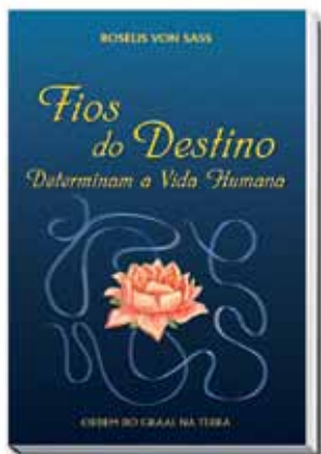
Edição de bolso