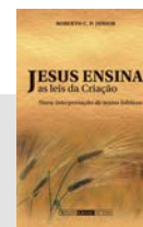
JESUS ENSINA AS LEIS DA CRIAÇÃO Roberto C. P. Junior Brochura • E-book

O autor faz ainda uma associação com a Lei da Atração da Igual Espécie: “A imagem do talento do servo negligente sendo dado ao que já tinha dez indica, conforme já esclarecido, a efetivação autônoma da Lei da Atração da Igual Espécie, que faz refluir automaticamente força intensificada a quem faz uso certo das dádivas recebidas, de modo a reforçar ainda mais a disposição deste em fazer o bem e gerar boas obras. Assim, ‘a todo o que tem se lhe dará, e terá em abundância, mas ao que não tem até o que tem lhe será tirado’ .”