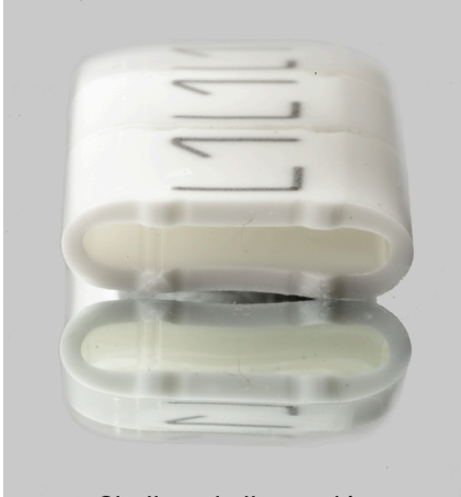
Similar a la ilustración