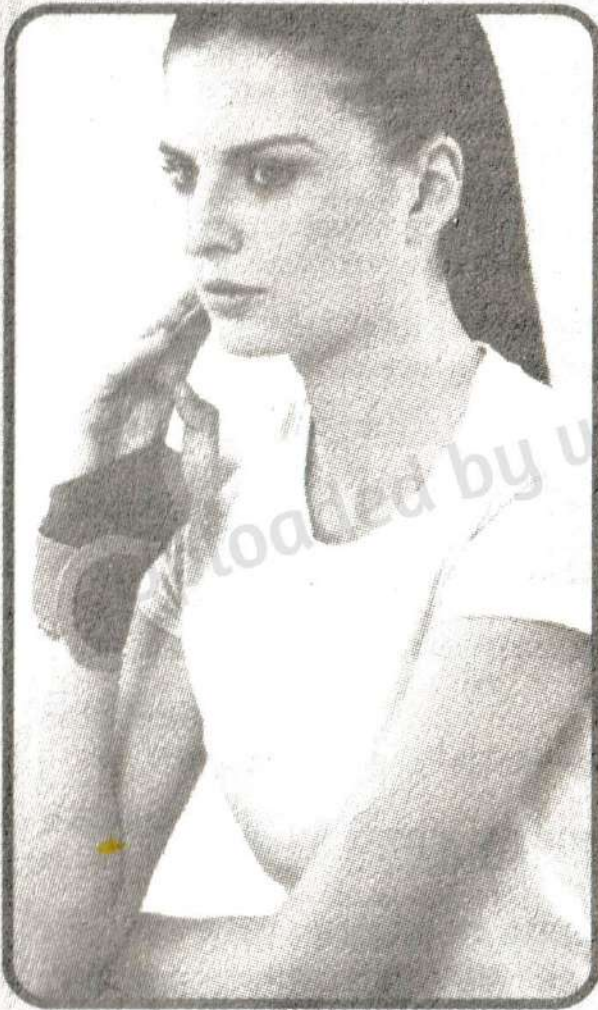
Wrist Brace With Thumb