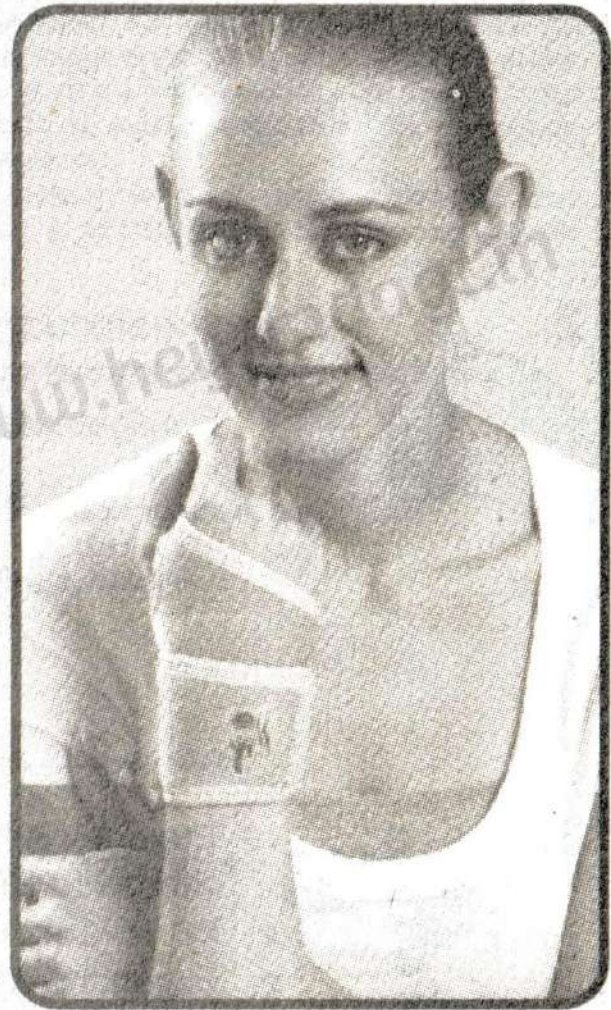
Wrist Brace With Thumb(Neoprene)