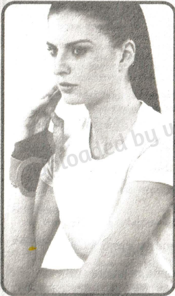
Wrist Brace With Thumb