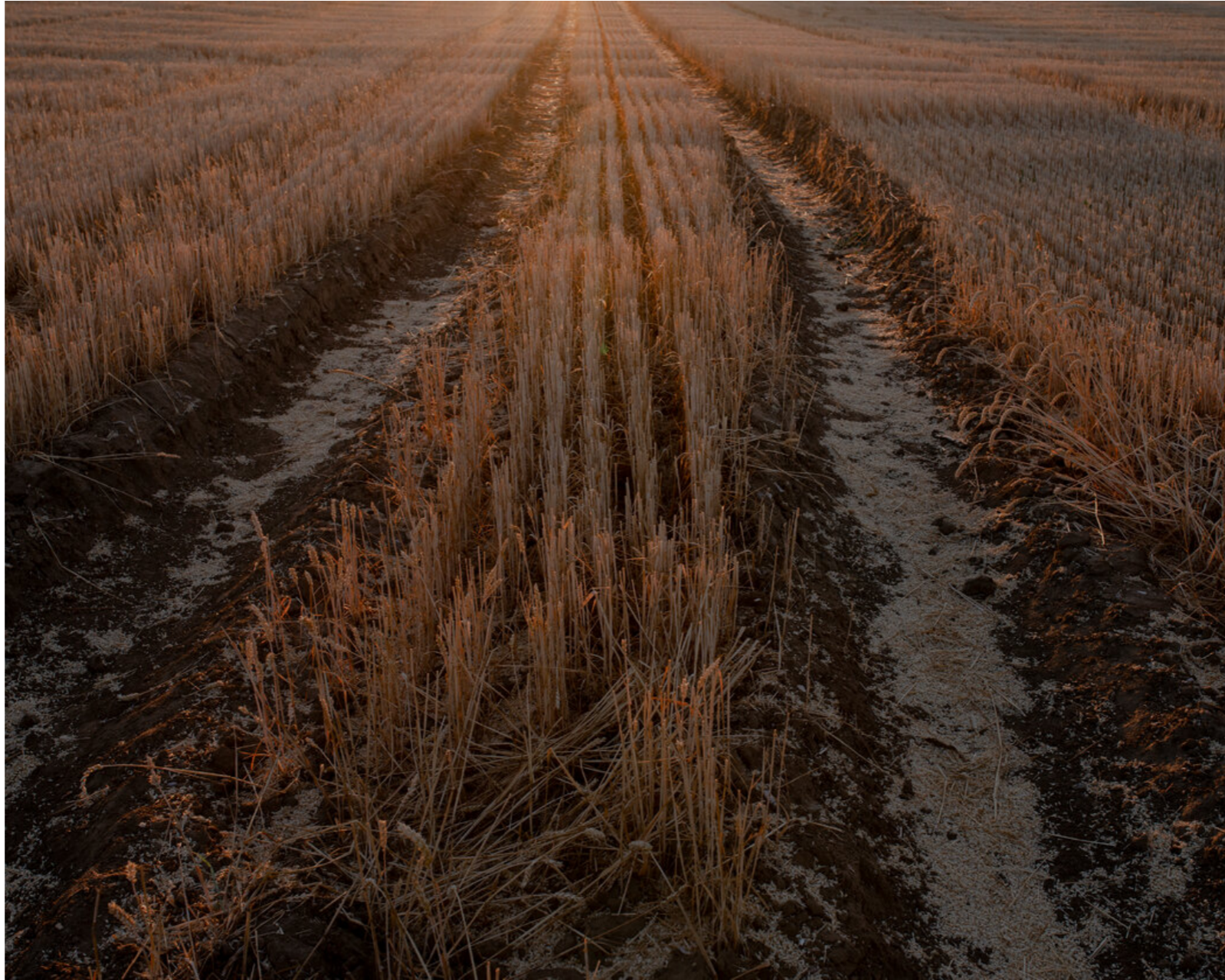
奧維爾的田野是梵·高喜歡的另一主題。