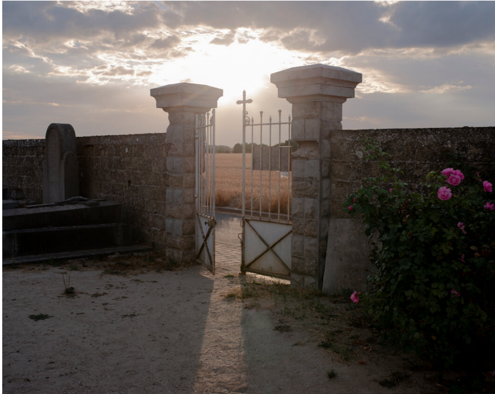
文森特和弟弟提奧都葬於奧維爾的這個墓地。