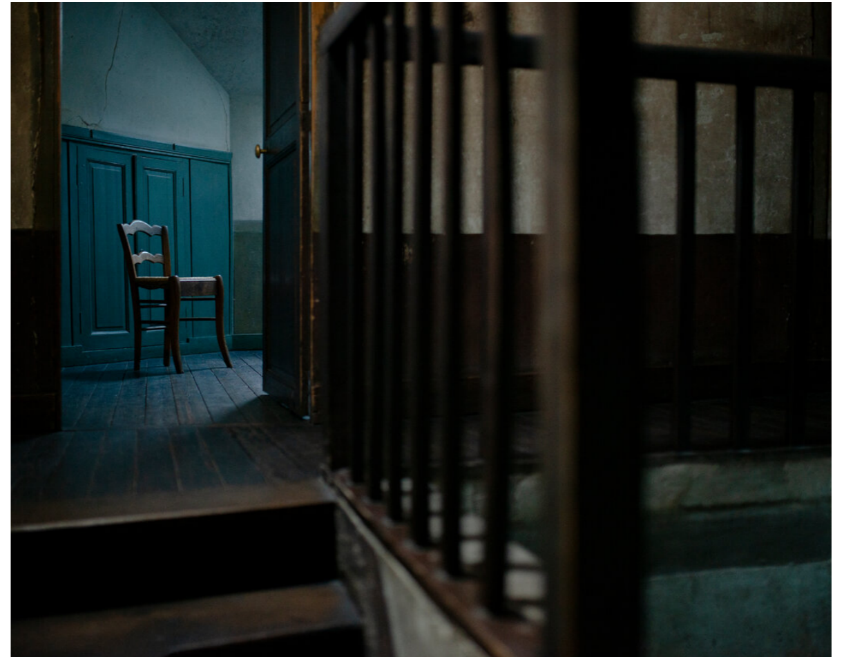
拉烏客棧梵谷房間的台階。

「以這幅畫來結束自己的生命再合理不過，」他說，「這幅畫描繪了生命的掙扎，還有與死亡的抗爭。這就是他所留下的。這是用色彩寫就的訣別。」