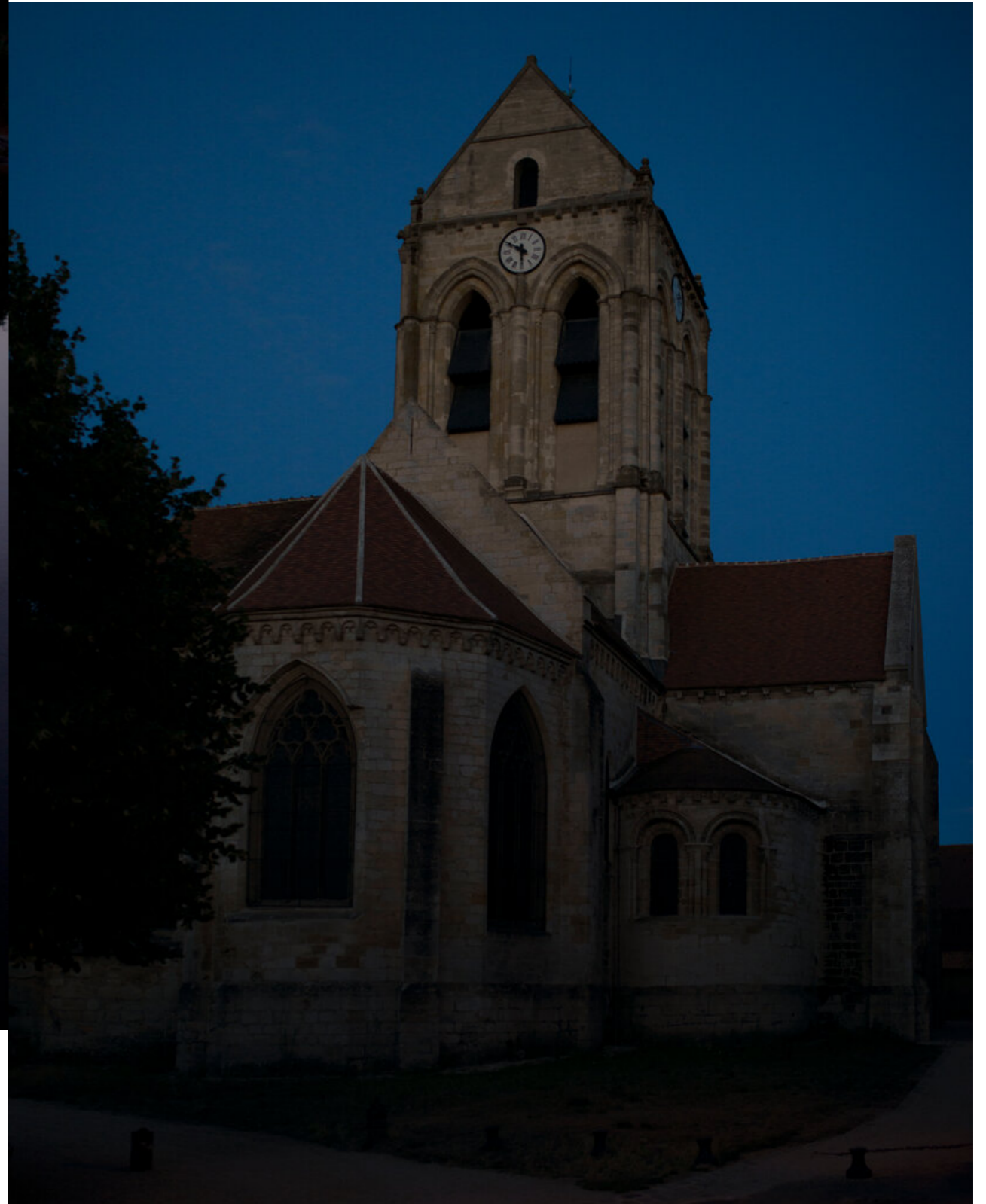
附近梵谷畫過的教堂 >