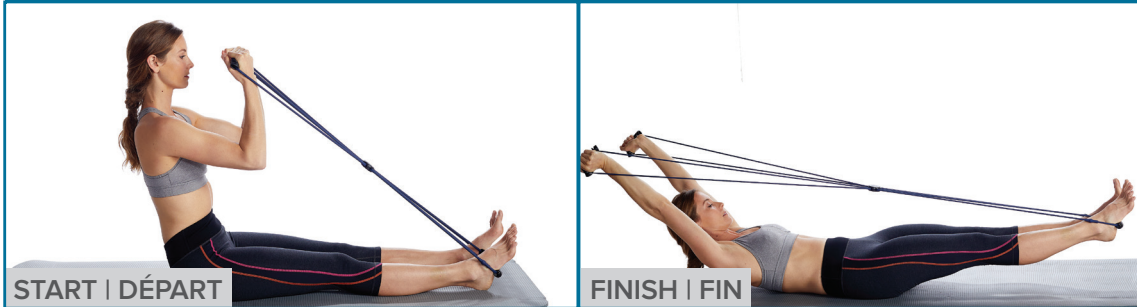
START | DÉPART