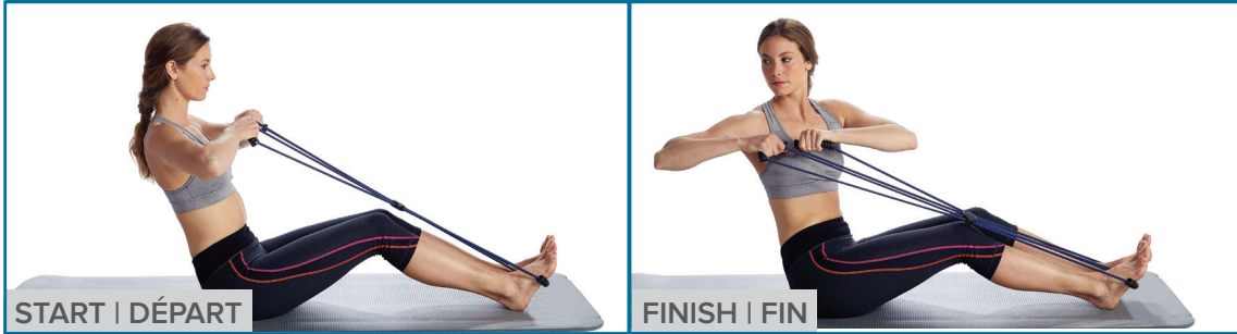
START | DÉPART