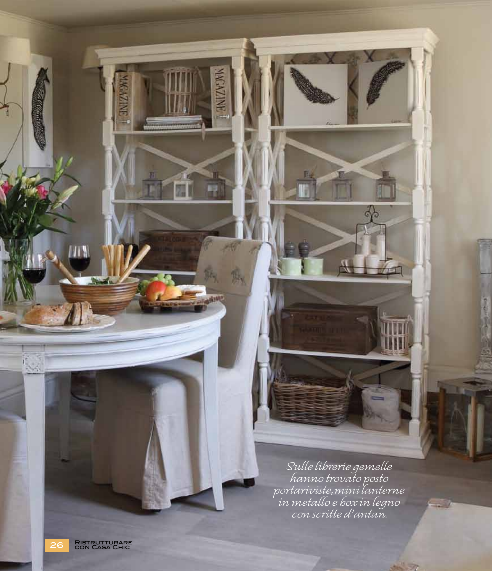
Sulle librerie gemelle hanno trovato posto portariviste, mini lanterne in metallo e box in legno con scritte d'antan.