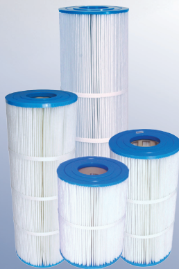
Cartuchos de repuesto para filtros