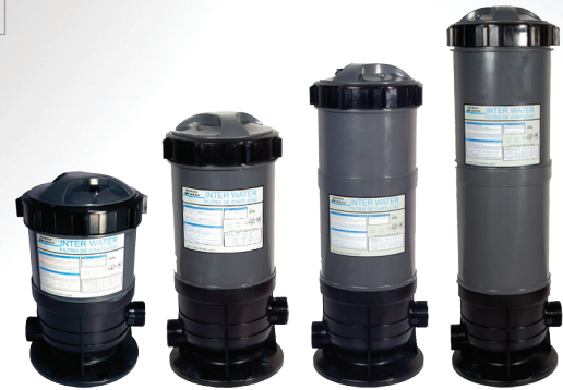
Filtros de cartucho Serie "Hurón"

Nota: 0.375 gpm/pie 2 para piscinas o spas comerciales es el estandar NSF. 1.0 gpm/pie 2 para piscinas o spas comerciales es el estandar NSF. ■ 3 años de garantía.