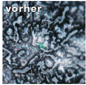
Dr. Emoto: „verstümmelt, keine Kristallbildung“