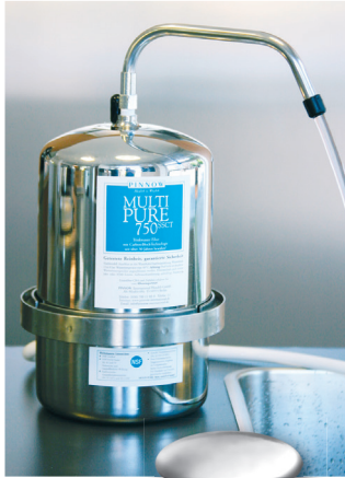
MULTI-PURE™ Trinkwasser-Filter mit SENSEH® Energie-Keramik

Berliner Leitungswasser mit MULTI-PURE™ Trinkwasser-Filter und mit SENSEH® Energie-Keramik