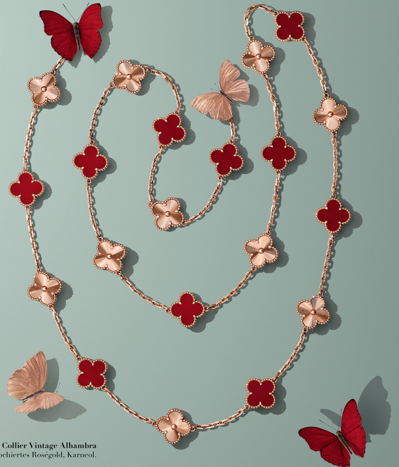
Langes Collier Vintage Alhambra Guillochiertes Roségold, Karneol.

Der Onlineshop Mucks verkauft Shirts mit Cocktailrezepten. Die Gründer:innen haben die Prints selbst designt und tragen sie händisch per Siebdruck auf die Shirts aus Biobaumwolle auf. Für jeden Geschmack ist etwas dabei: Basil Smash, Espresso Martini, Negroni. mucks-shop.ch