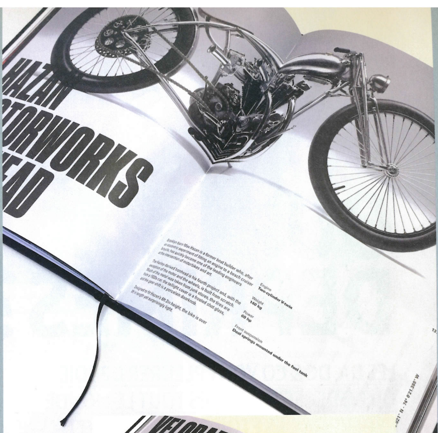
Ci-dessus, Hazan Motorworks Ironhead (2 cylindres en V, 140 kg). Ci-contre, Velorapida, The Black.