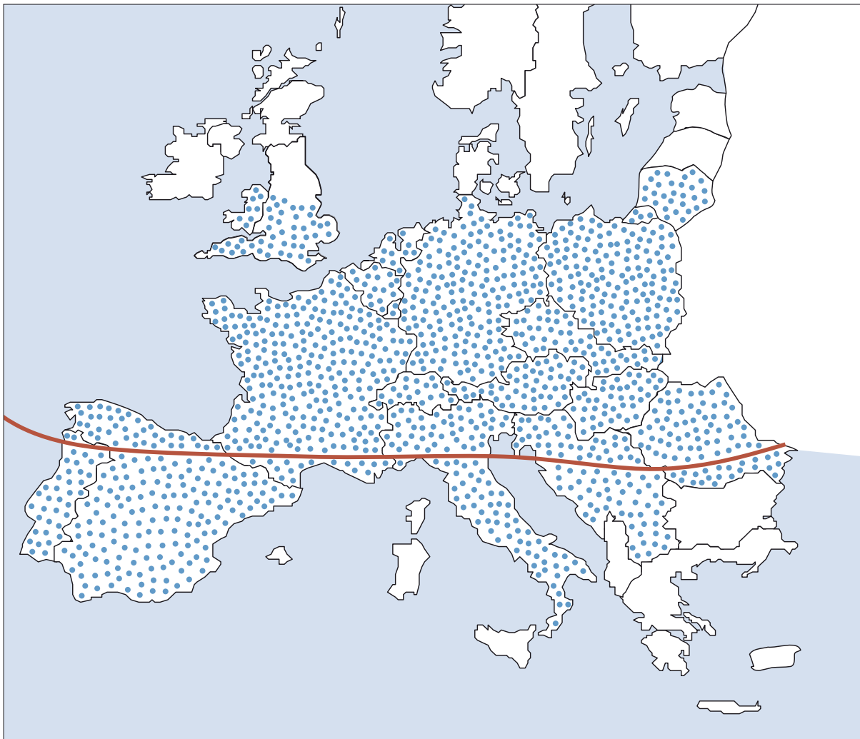
Abbildung 2b: Verbreitungsgebiet von Dermacentor reticulatus in Europa (Vorkommen in allen gepunkteten Regionen, jedoch bevorzugt oberhalb der roten Linie)

während des Saugakts über den Speichel übertragen werden oder im Fall von Hepatozoon spp. nach oraler Aufnahme der Zecke durch den Wirt.