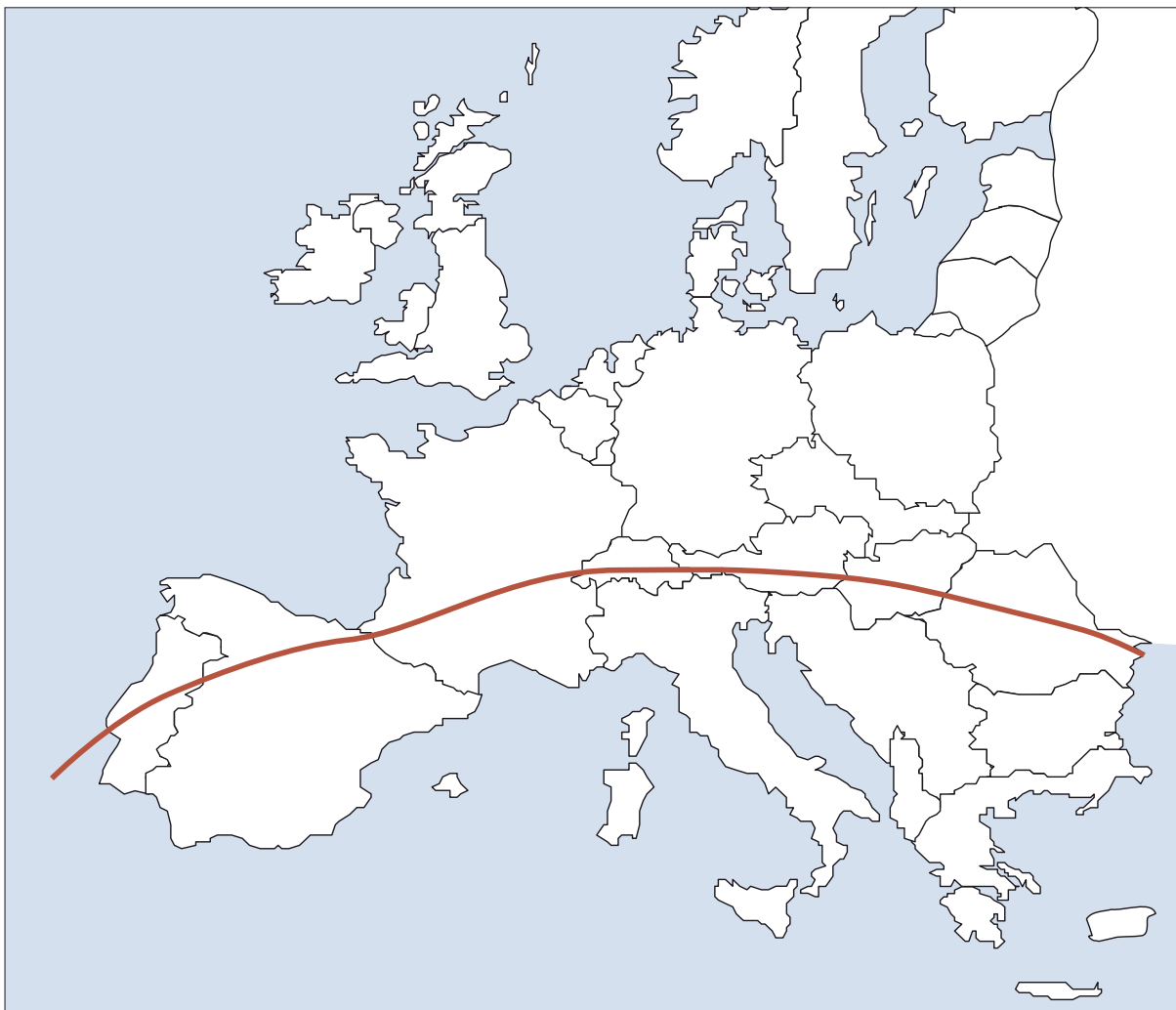
Abbildung 2a: Verbreitungsgebiet von Rhipicephalus sanguineus , die ursprünglich eine südeuropäische Zecke ist (unterhalb der roten Linie häufigeres Vorkommen)

Zecken sind Parasiten, die temporär Blut saugen und sich unterschiedlich lange auf ihren Wirten aufhalten. Bei Schildzecken dauert der Saugakt je nach Entwicklungsstadium 2-10 Tage. Klinisch betrachtet sind Zecken vor allem als Vektoren für Protozoen, Bakterien und Viren von Bedeutung, die von der Zeckenart und dem geografischen Standort abhängt (Tabelle 4, S. 30). Infektionen können