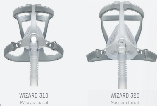
WIZARD 310 Máscara nasal

Las WIZARD 310 y 320 tienen una estructura flexible y un diseño que brinda mayor comodidad al usuario.