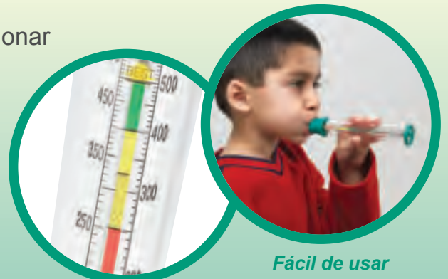
Fácil de usar