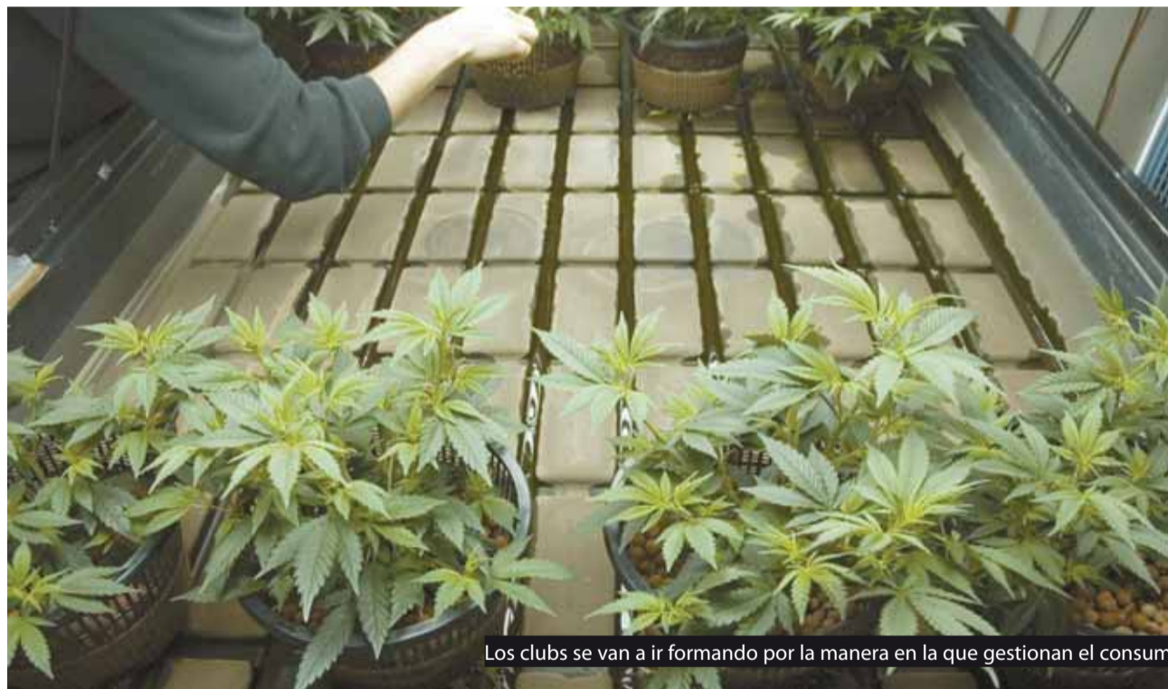
Los clubs se van a ir formando por la manera en la que gestionan el consumo