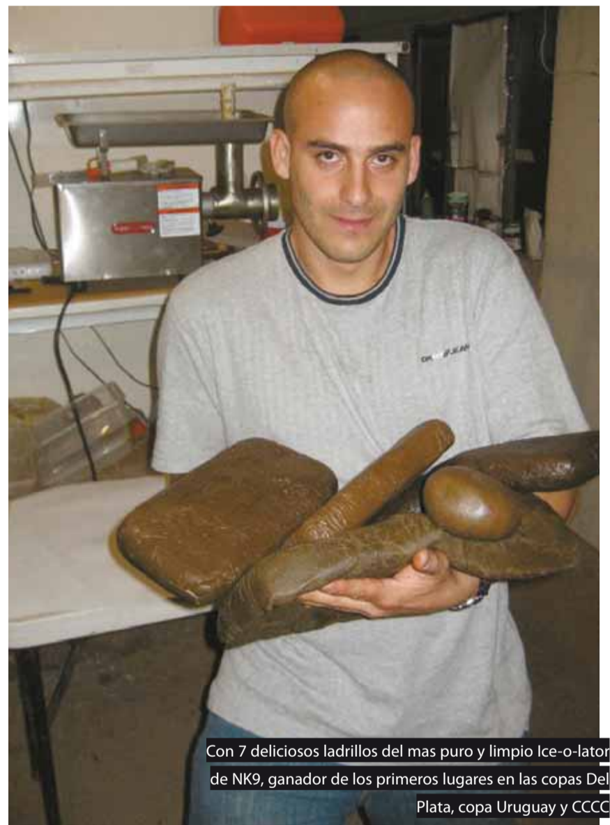
Con 7 deliciosos ladrillos del mas puro y limpio Ice-o-lator de NK9, ganador de los primeros lugares en las copas Del Plata, copa Uruguay y CCCC

En Israel, la Universidad de Tel-Aviv lleva