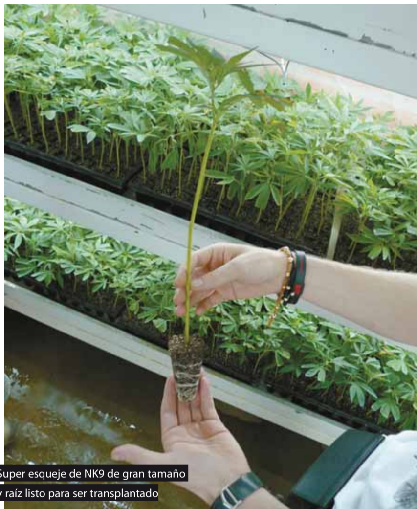
Super esqueje de NK9 de gran tamaño y raíz listo para ser transplantado

De la experiencia colombiana, claro, y luego en Estados Unidos, donde mi familia se mudó cuando yo tenía 13 años. Allí viví lo peor de la cultura prohibicionista, donde para prender un porro estás pendiente del espejo y siempre tienes a un policía en la cabeza. Pero en 2001, con 23 años, me fui a Europa. Y ahí vi que había