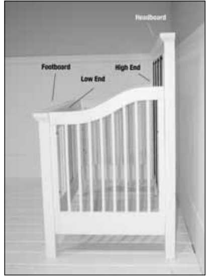
Diagram 2 (Schéma 2)