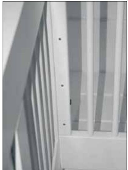
Diagram 4 (Schéma 4)