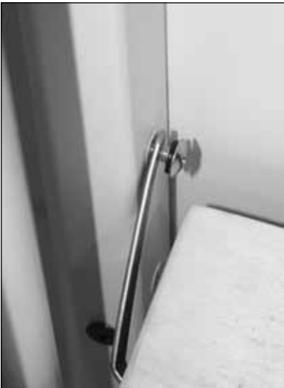
Diagram 3 (Schéma 3)