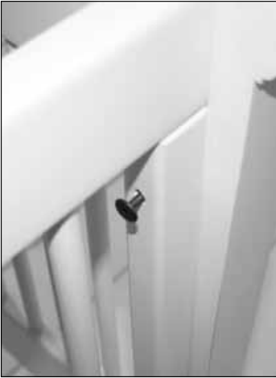
Diagram 1 (Schéma 1)