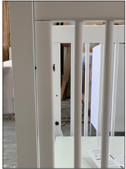
Diagram 2 (Schéma 2)