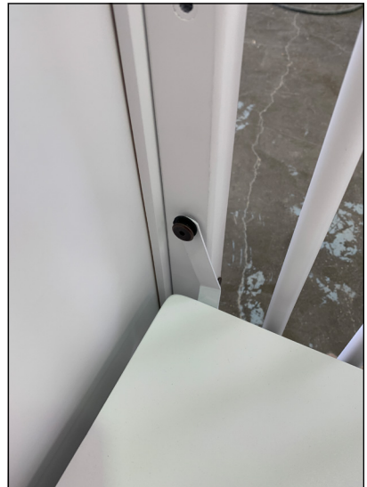
Diagram 4 (Schéma 4)