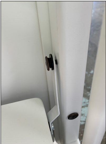
Diagram 3 (Schéma 3) 7/8" Allen Bolt, 1/2" Lock Washer, 3/4" Washer