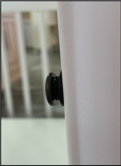
Diagram 1 (Schéma 1) 2 1/16" Allen Bolt, 1/2" Lock Washer, 3/4" Washer