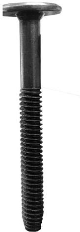
(8) 2 7/16" (60mm) Allen Bolts