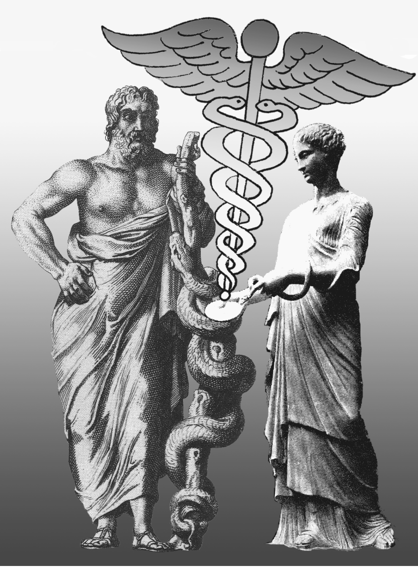
Resim 2— Yunan Şifa Tanrısı Aesculapius ve kızı Yunan Sağlık Tanrıçası Hygieia, ellerinde tıp dünyasının sembolü olan "Kadüse" denilen çift yılanlı sihirli asayı tutmaktalar.