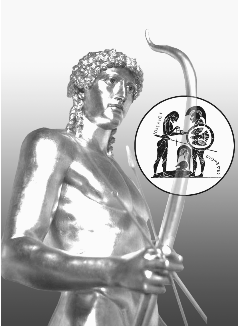
Resim 1— Hekim Apollon ve küçük resimde Yunanlı şifacı, bir Homerik savaşının yarasını sararken.