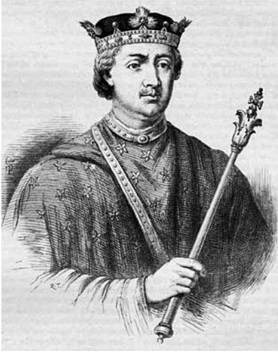
Kral II. Henry: Ne sakal var ne nezaket ama kafa zehir.

söylense de aslında darma- dağın kızıl saçlı, gözleri kan çanağı, tıknaz, göbekli ve pespaye giyimli bir adam- dı. Söylenenlere göre, yüzü bir aslaninkine benziyordu. Hatta şeytanın soyundan gel- diğinde dair, öz ailesinin de desteklediği bir söylenti bile vardı. İlk bakışta Eleanor'un hiç tipi değildi. Saraydaki aşk şiirleri yarışmasını kazan- ması beklenemezdi.