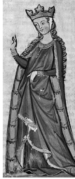
Süper-fıstık Akıtanyalı Eleanor.

Cidden, bugün herhangi bir pop yıldızı herhangi bir tartışma, bir gösteriye, bir protestoya, trafikte bir kavgaya, bir bar atışmasına elinde mızrağıyla yarı çıplak karışsa bile gözümüz kamaşır bizim. Instagram'a, uygulamanın meme resimlerini yasaklayan politikasını ihlal ederek üstsüz resmini koyduğunda Rihanna'ya