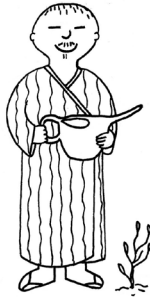
Lin Plin Plo