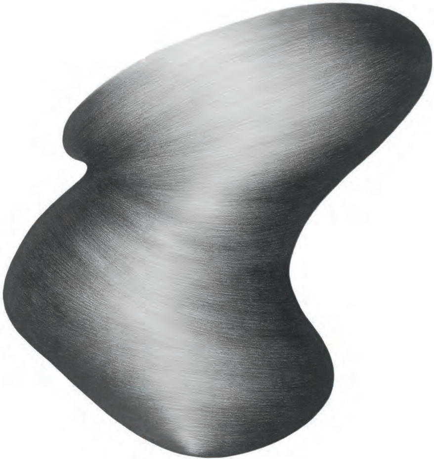
O.T. a.d.S. Your secret, perched in ecstasy 2022 100 x 70 cm, 3B-Bleistift auf Papier