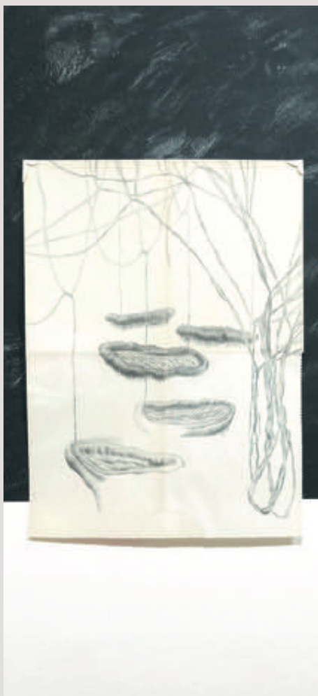
Dominika Trapp, Entangled, Engaged, Ensnared, 2023

A 2023/24-es, az Átlépni a kereteket. Breaking the Frame kiállítás címe arra utal, hogy a kiállított pozíciók között feltűnően sok szakít a hagyományos, „autonómnak” vélt képformátumokkal, illetve ezeket sorozatokkal, műcsoportokkal vagy térbeli installációkkal váltja ki.