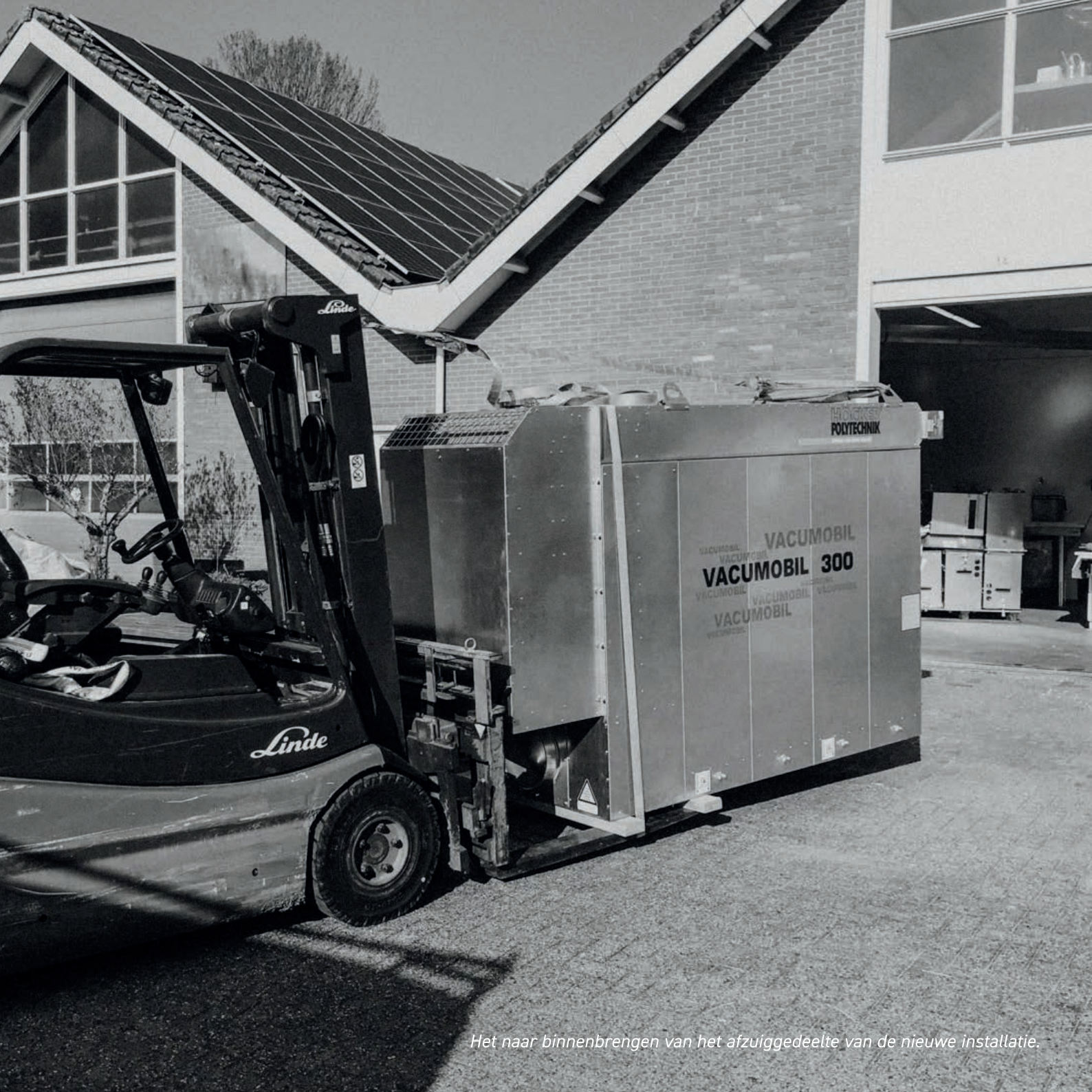
Het naar binnenbrengen van het afzuiggedeelte van de nieuwe installatie.