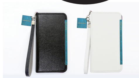
iPhone6/6s、iPhone7/8、iPhone7Plus/8Plus、iPhone Xに対応 カラー: ブラック、ホワイト/高岡銅器チャームストラップ付き

今回、Makuake限定で先行特別販売するスマホケースは、デザイン、機能、品質に徹底的にこだわりぬいた結果、全ての素材、パーツ、縫製がMade in Japanです。