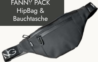
FÄNNY PACK HipBag & Bauchtasche

2,5 % des Gewinns im Jahr 2021 werden gespendet