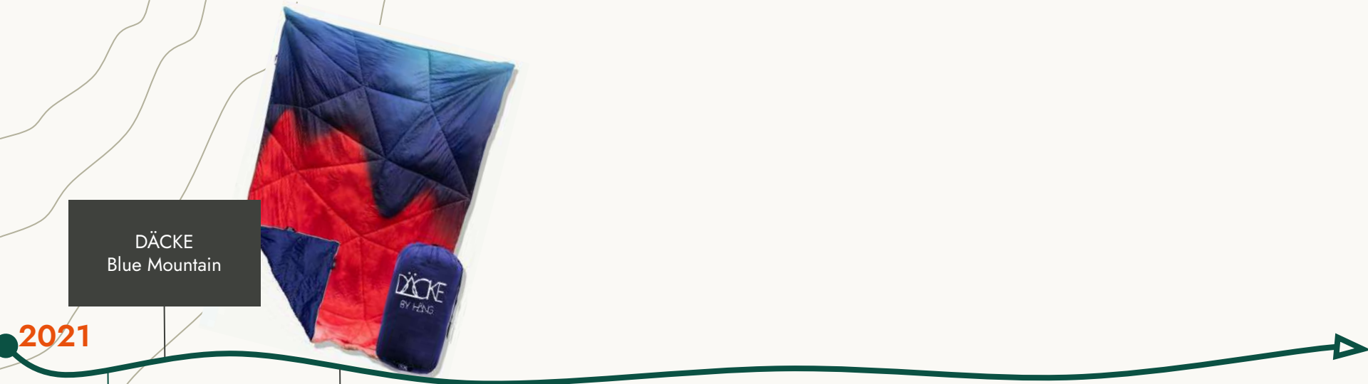
DÄCKE Blue Mountain