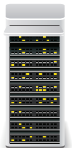
Serveur Yealink RPS

Le Yealink T4S prend en charge une mise en service efficace et permet un déploiement de masse sans effort grâce au service de redirection et de mise en service (RPS) gratuit de Yealink. Par ailleurs, le T4S comporte un micrologiciel unifié et un modèle de mise en service automatique qui s'applique à tous les modèles de téléphone (T41S, T42S, T46S et T48S), afin de faire gagner encore plus de temps et de réduire les coûts informatiques pour les entreprises.