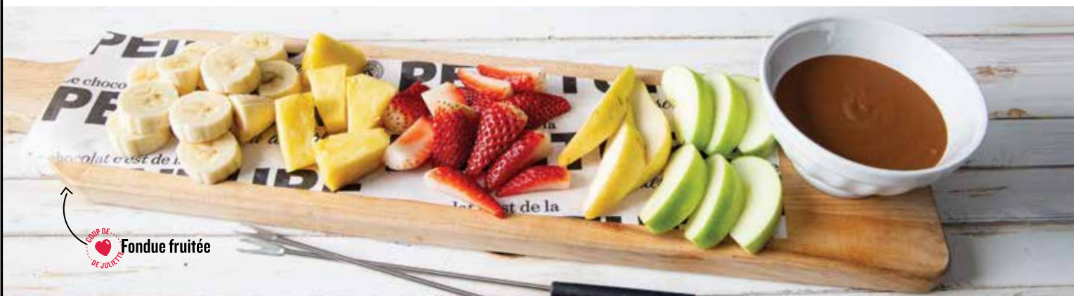
♥ Fondue fruitée

♥ Notre tartinette cacao-noisette et noisettes caramélisées +2.99