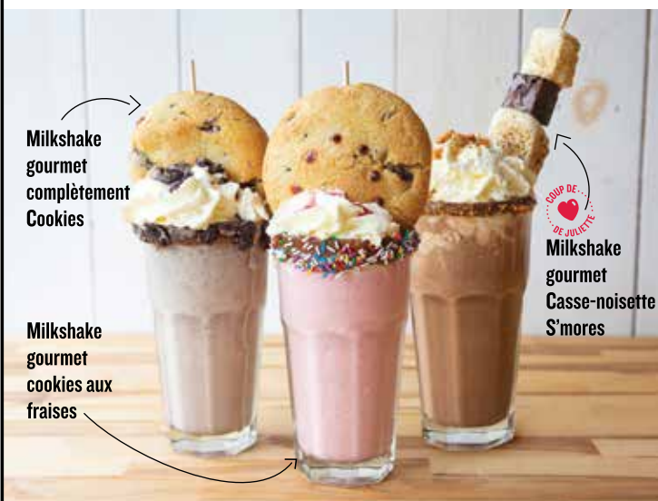
Milkshake gourmet complètement Cookies

Un frappé onctueux à la fraise couronné de crème fouettée, de notre coulis de fraises et de notre Dracookie!