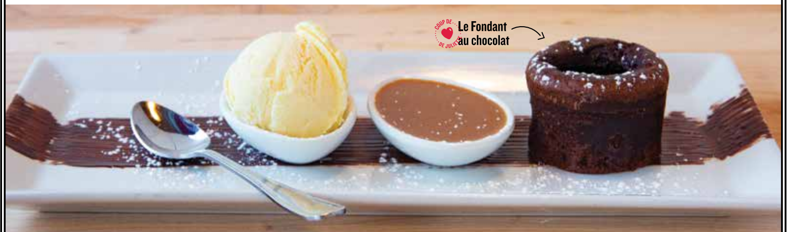
C.O.U.P. DE CŒUR DE JULIETTE Le Fondant au chocolat

NOS EXTRAS: Crème Fouettée : 2.29 / Caramel fleur de sel : 3.29 / Chocolat : 3.29 / Tartinade cacao-noisette : 3.59 / Boule de crème glacée vanille : 3.59 / Compotée de fraises maison : 3.29