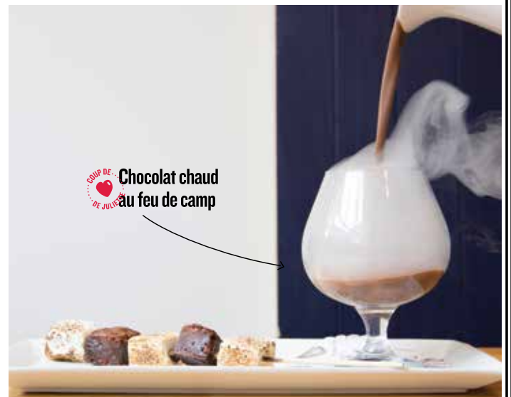
Chocolat chaud au feu de camp

Chocolat chaud au feu de camp 15.99 DE RETOUR! Vivez une expérience chocolatée autour d'un feu de bois avec notre chocolat chaud gourmand et onctueux fumé aux copeaux de bois et servi avec une brochette de brownies et de guimauves torchées. Saveur au choix : Noir 70%, Noir 55%, Lait 33% ou Blanc.