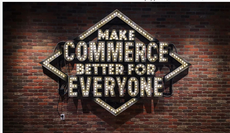
Bild aus dem Shopify HQ in Ottawa, Kanada

So kannst Du dich bei deinem Ecommerce mehr mit Verkaufen beschäftigen - und weniger mit Verwalten :)