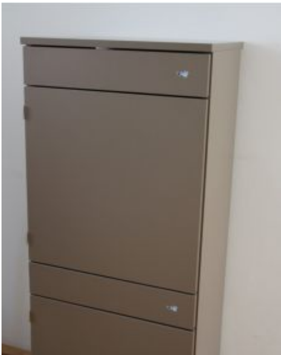
Bildtext: Tapkey Zustellbox