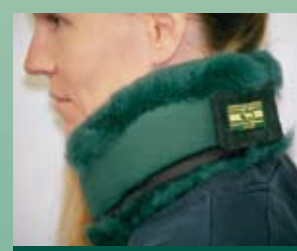
Anneau de support pour la nuque (2 tailles)