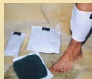
Protection anti-pression pour les membres (4 tailles)

Les courroies de Velcro douces ne couperont pas la peau et peuvent s'ajuster à n'importe quelle taille.