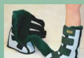
Longue botte divisée S'ajuste à la jambe et au pied

SSBS (petit) SSBL (grand) SSBM (moyen) SSBXL (très grand)