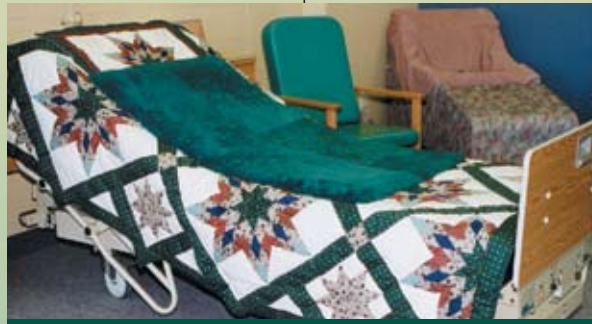
Coussin de lit

UNICW18M 16" par 18" (siège et dossier) ARI Appuie-bras (paire)-exige des mesures CPI Appuie-mollet (paire) FRI Appuie-pied (paire)