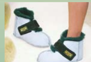
Bottes courtes (accès facile - 4 pointures)

MMRS (semelles de caoutchouc) MMSS (semelles de suède)