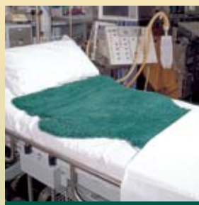
Coussin de fauteuil et de lit Environ 39" par 30"

Les coussins de lit sont entièrement faits de peaux de mouton australiennes naturelles Merino. Peaux de mouton australiennes Merino disponibles en vert médical seulement. Laver à haute température (80°C) avec le détergent liquide SKINSAN et sécher par culbutage.