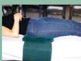
Bande de lit Sert de couvre-oreiller pour les épaules, le coccyx ou les talons et les chevilles