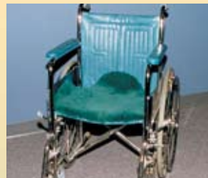
Coussin contour pour fauteuil roulant