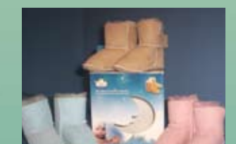
Cozy Steps - pour bébé