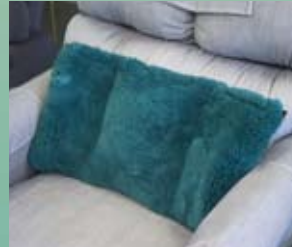
Soutien lombaire ajustable