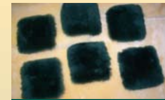
Coussins pour coccyx (5" par 5")

RCP-2 (petit - moyen) RCP-3 (moyen - grande)