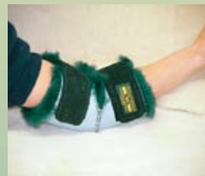
Protège-coude (1 chacun)

PPM - Régulier PPMF - Avec séparateurs pour les doigts