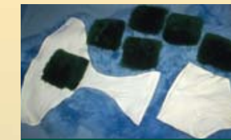
Culotte et coussins pour coccyx réutilisables

LSBS (petit) LSBL (grand) LSBM (moyen) LSBXL (très grand)