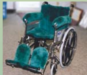
Housse pour siège et dossier de fauteuil roulant

UNICW18M 16" par 18" (siège et dossier) ARI Appuie-bras (paire)-exige des mesures CPI Appuie-mollet (paire) FRI Appuie-pied (paire)