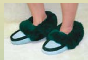
Mocassin médical (avec semelles de suède ou de caoutchouc)

EPSMHS (small) EPSMHL (large) EPSMHM (med) EPSMHXL (X-large)