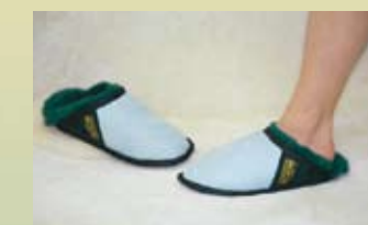
Mules médicales (4 pointures)

SSMS (petit) SSML (grand) SSMM (moyen) SSMLX (très grand)