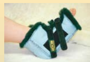
Pantoufles chirurgicales (bout ouvert)

PCBMHS (petit) PCBMHL (grand) PCBMHM (moyen) PCBMHXL (très grand)