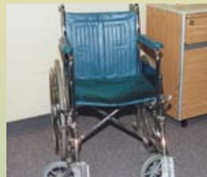
Coussin de forme normale pour fauteuil roulant