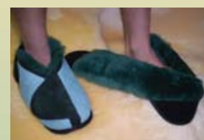
Pantoufle enveloppante avec semelle en caoutchouc

EPSMHS (small) EPSMHL (large) EPSMHM (med) EPSMHXL (X-large)