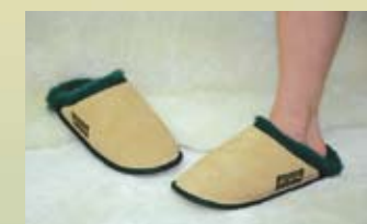
Mules haut de gamme style et avantages de la peau de mouton médicale

SSMS (petit) SSML (grand) SSMM (moyen) SSMLX (très grand)