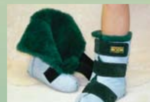
Bottes longues régulières (accès facile - 4 pointures)

SBMS (petit) SBML (grand) SBMM (moyen) SBMXL (très grand)