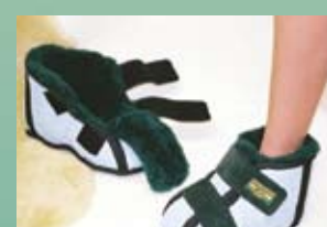
Botte courte divisée Pour ulcères diabétiques et orteil en marteau

LBMS (petit) LBML (grand) LBMM (moyen) LBMXL (très grand)