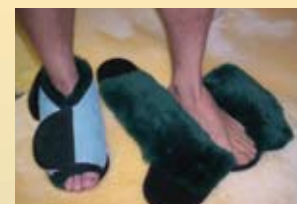
Pantoufle à pression avec semelle en caoutchouc

PCBMHS (petit) PCBMHL (grand) PCBMHM (moyen) PCBMHXL (très grand)