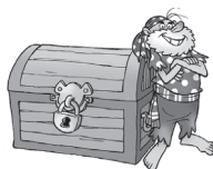
Junto a (la, los, las) Junto al