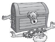
Debajo de (la, los, las) Debajo del