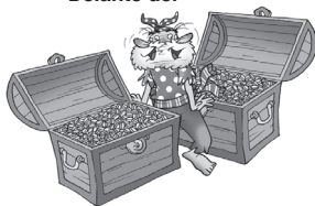
Entre (el, la, los, las)