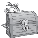
Detrás de (la, los, las)