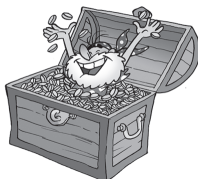
Dentro de (la, los, las) Dentro del