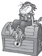
En (el, la, los, las)