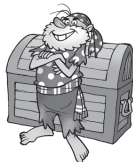
Delante de (la, los, las) Delante del

Las preposiciones que se podrán usar son: