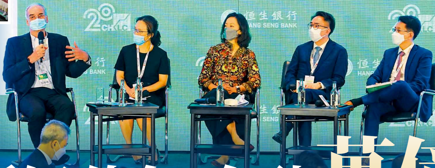
香港上市公司商會在去年十月舉辦第二屆「環境、社會及管治與綠色金融機遇論壇」，聚焦探討應對氣候變化及相關的金融商機。