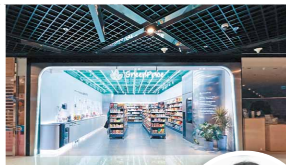
▲ GreenPrice由市集攤檔做起，至今已發展至坐擁九間分店。

育分享和綠色零售金融方案，「當中設有『Invest Better』功能，支援客戶購買並提供超過二百五十隻於MSCI ESG基金評級達『AAA』或『AA』的基金或獲證監會認可的ESG基金，透過投資來支持理念相符的企業。」星展銀行（香港）可持續發展金融執行董事麥礎允說。 他指出，在綠色金融的概念中，銀行扮演的角色是分配資金以協助建立永續生態系統，「當然我們在整個可持續發展生態系統中只是其中一部分，我會形容我們的工作是擔當交通督導員，透過做好投資教育，讓投資者了解投資綠色金融的重要性，以達到將資金流向綠色項目的目標。」 綠色貸款是綠色金融中重要一環，為企業提供貸款的銀行亦需充當綠色顧問，為客戶評估氣候風險。麥礎允以星展兩年前與冠忠巴士（0306）簽訂首筆可持續發展表現掛鈎貸款為例，「這筆可持續發展表現掛鈎貸