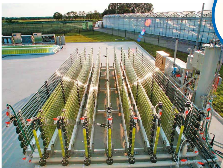
◀財利科技主力產被視為「綠色黃金」的微藻，過程中會將空氣中的二氧化碳轉化為氧氣，為他們帶來「碳權交易」的額外收入。

在永續發展浪潮下，愈來愈多企業開始主動將ESG納入營運考量，不過有不少傳統產業難以在短時間內轉型，暫時未能擺脫高碳排放的情況，因此會在交易平台上向「減碳有成」兼得到相關認證而取得大量碳權的公司購買碳權。