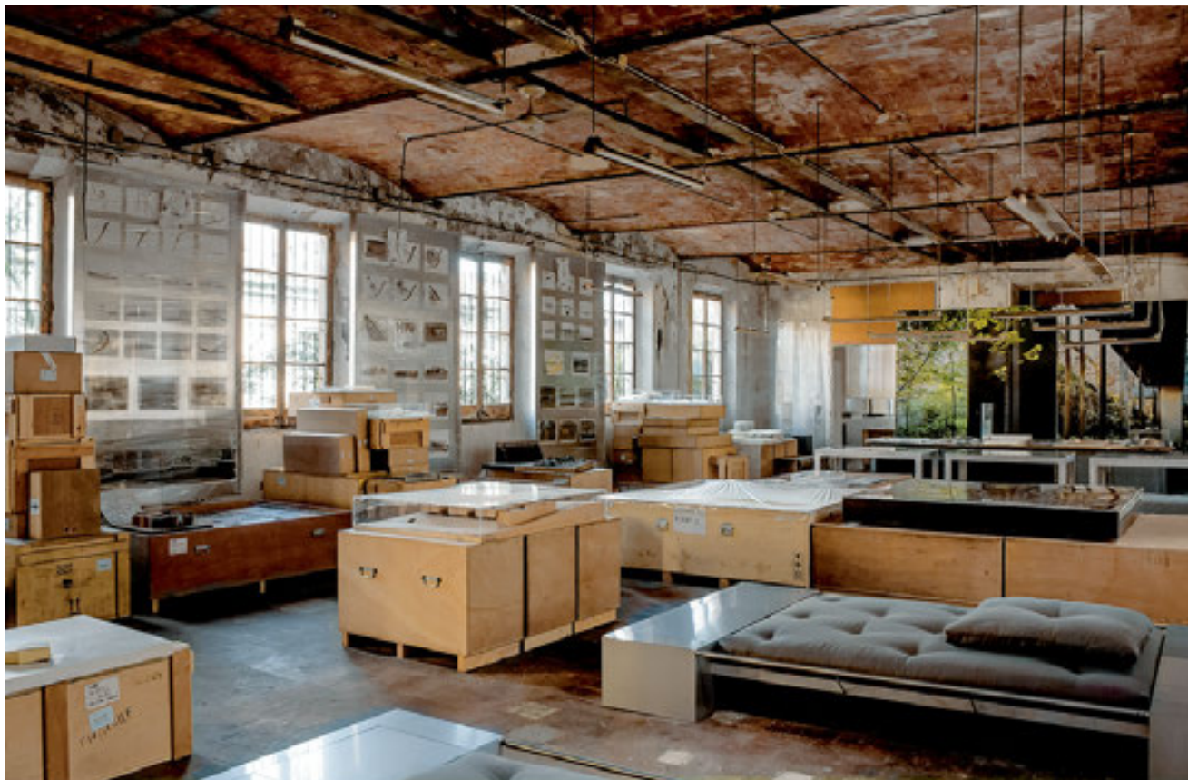
ESPACIO RCR BUNKA