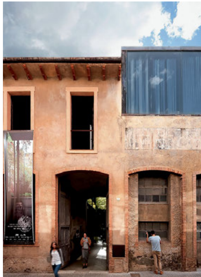
ESTUDIO RCR ARQUITECTES