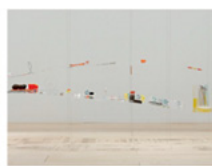
Tokio Art Meeting II: Architectural Environment for tomorrow. MOT MUSEUM OF CONTEMPORARY ART TOKIO 2011-2012