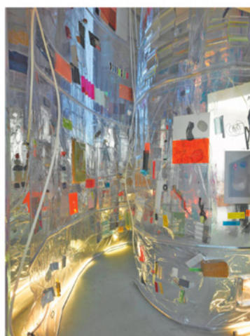
People meet in Architecture. BIENNALE VENEZIA 2010