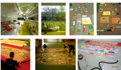
vacuum packing. Venecia 2010