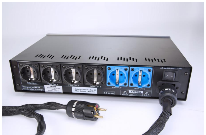
Symbolfoto, Netzkabel nicht im Lieferumfang!