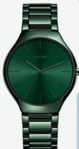
Från 19 900 kr, Rado True