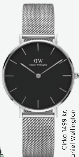
Cirka 1499 kr, Daniel Wellington