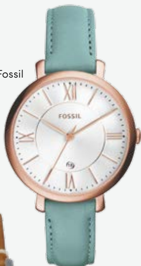
1295 kr, Fossil