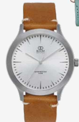
1395 kr, Boomwatches