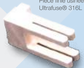
Pièce finie usinée Ultrafuse® 316L

Note : 50 pièces d'outillage ont été imprimées et usinées en finition. Les économies réalisées grâce aux métaux additifs par rapport à un usinage à 100 % ont été de 2 318 dollars.