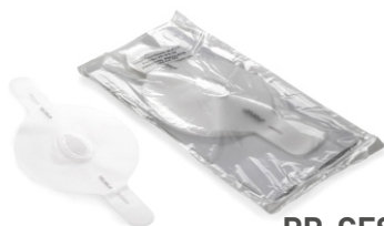
PP-CFS-50 Protezioni facciali pediatriche, confezione 50 pezzi