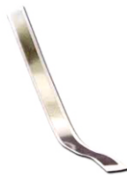
M5089A Adattatore training DAE, montaggio esterno, 5 pezzi