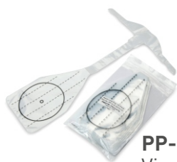
PP-CLB-50 Vie aeree/protezioni facciali pediatriche, 50 pezzi