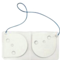
M5088A Adattatore training DAE, montaggio interno