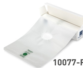
10077-PPS Protezioni facciali in rotolo, confezione 36 fogli, ordine minimo 6 pezzi