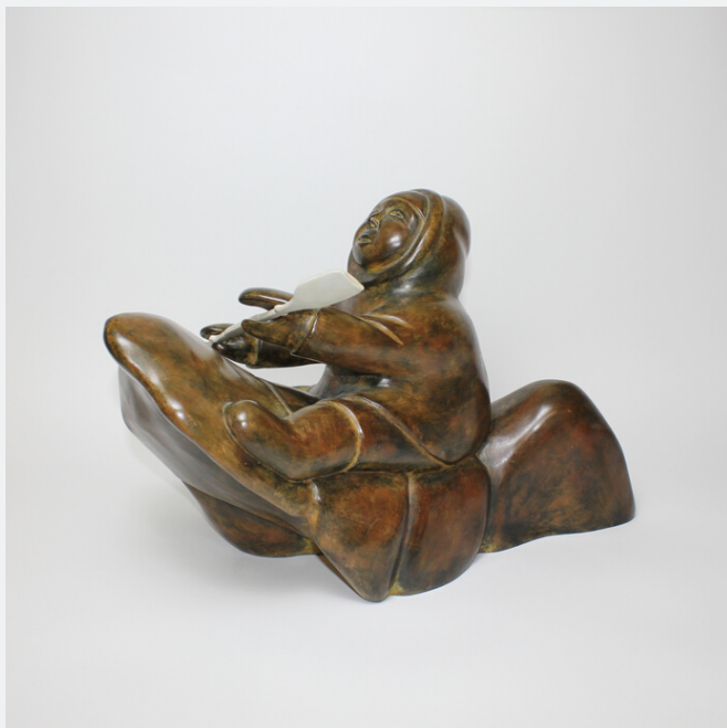
MAN RIDING ON AVATAQ (4/9), 1978

Bronze, bois de caribou | Bronze, antler 31.75 x 46.99 x 25.4 cm | 12.5 x 18.5 x 10 in