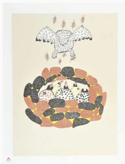
MOSQUITOES (32/50), 1982