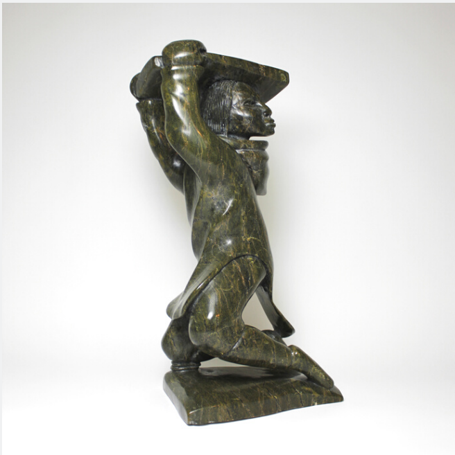
MAN CARRYING STONE, C.1998

Serpentine 50.8 x 20.32 x 27.94 cm | 20 x 8 x 11 in