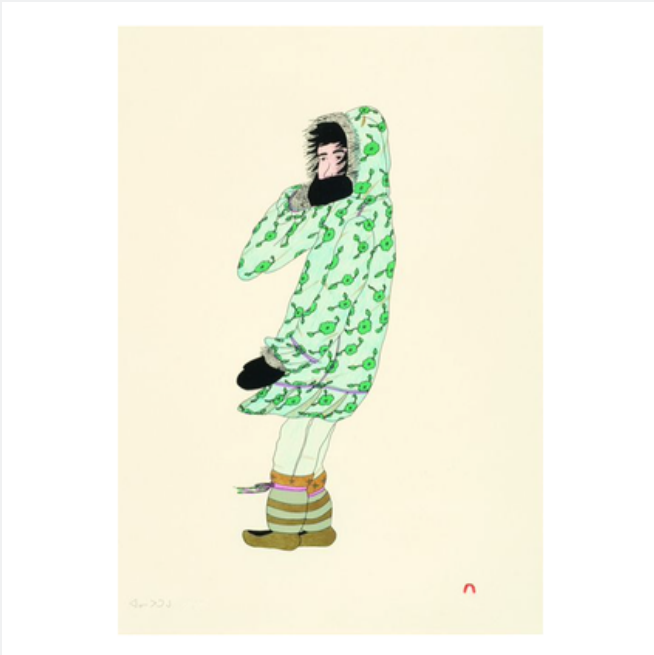
WINDY DAY, W.B.E.C.IV/V, 2006

Lithographie | Lithograph 56.5 x 38.5 cm | 22.24 x 15.16 in