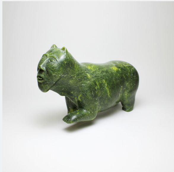
BEAR WITH HUMAN FACE, C.1990