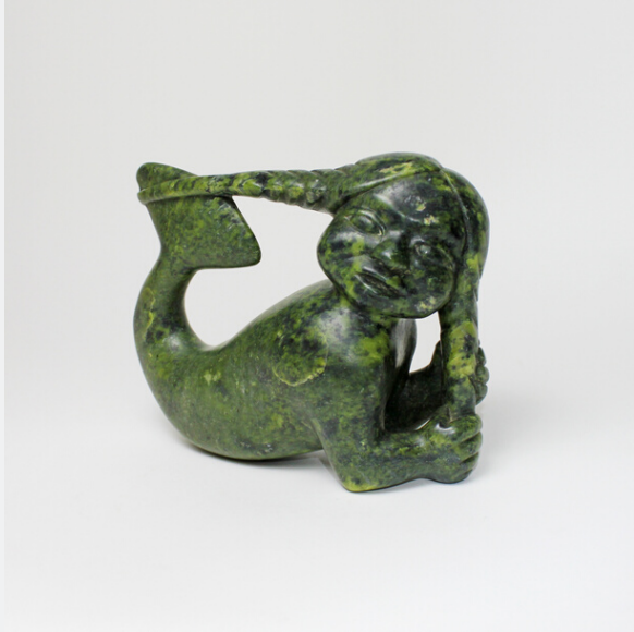
SEDNA BRAIDING HER HAIR, C.1958