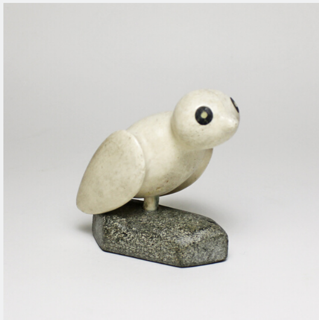
BIRD, C. 1953

Os de mâchoire de baleine, encre | Whale jaw bone, ink 10 x 5.5 x 8 cm | 3.94 x 2.17 x 3.15 in