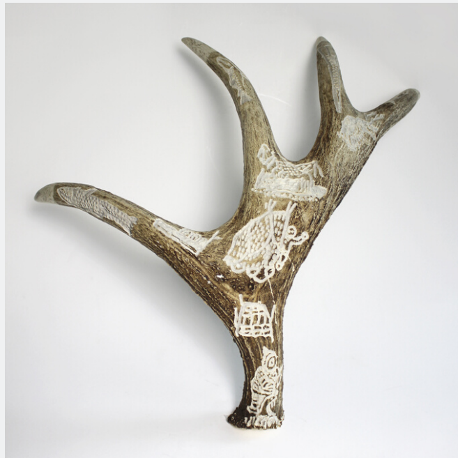
SANS TITRE, C.2014

Basé à Kinngait (Cape Dorset, NU), le sculpteur et graveur accompli Kiugak Ashoona a été parmi les premiers à participer au mouvement de production artistique de Kinngait. Ses sculptures sont connues pour leur fluidité et leur imagerie dramatique, notamment les postures agiles, les becs pointus et les yeux expressifs. Travaillant principalement avec de la serpentinite d'un vert profond, ses sculptures sont très détaillées, dynamiques et ambitieuses. Kiugak Ashoona a souvent exploré dans ses œuvres la relation entre les personnes et les êtres, ainsi que leur lien avec la terre. Il a été nommé Officier de l'Ordre du Canada (2000) et élu à l'Académie royale des arts du Canada (2003).