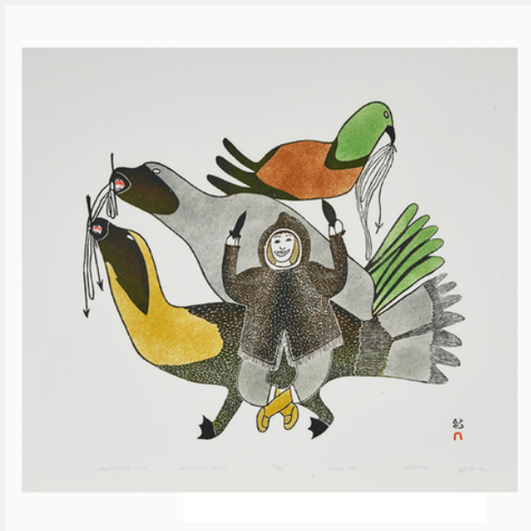
JOYOUS AT THE HUNT (37/50), 1980

Gravure sur pierre, pochoir sur papier | Stonecut, stencil on paper