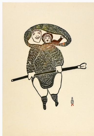
FISHERWOMAN (22/50), 1967