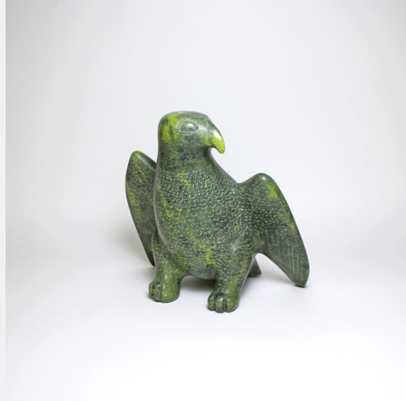
BIRD OF PREY, C.1958