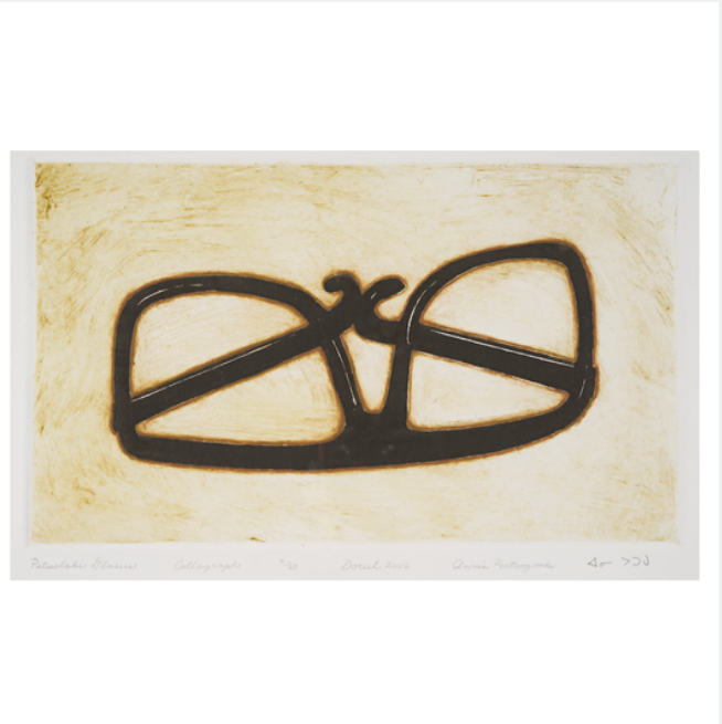
PITSEOLAK'S GLASSES, W.B.E.C.I/IV, 2006

Collographie | Collagraph 33 x 50 cm | 12.99 x 19.69 in