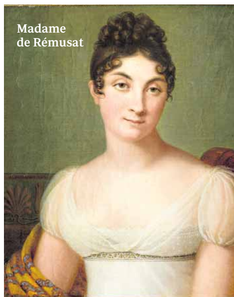
Madame de Rémusat

Las guerras privadas del clan Bonaparte M. de Rémusat Arpa, 2019 320 páginas 19,90 euros