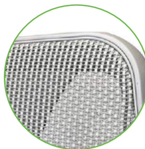
Filet et structure en gris clair

L'assise et le dossier du fauteuil tCentric Hybride MC sont tous deux faits de mailles élastomères et de fils de trame en polyester perméables à l'air, à la chaleur corporelle et à la moiteur. Une fois étiré, ce matériau possède une excellente capacité structurale et une résistance incomparable, affichant une perte de portance de moins de 5% lors des essais réalisés selon les normes de la BIFMA.