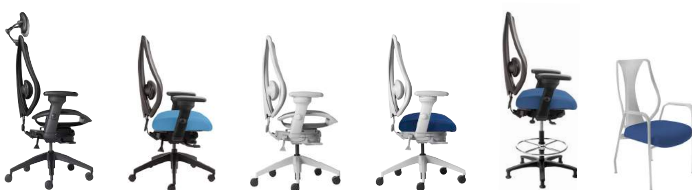
Tout filet Illustré avec appui-tête en option