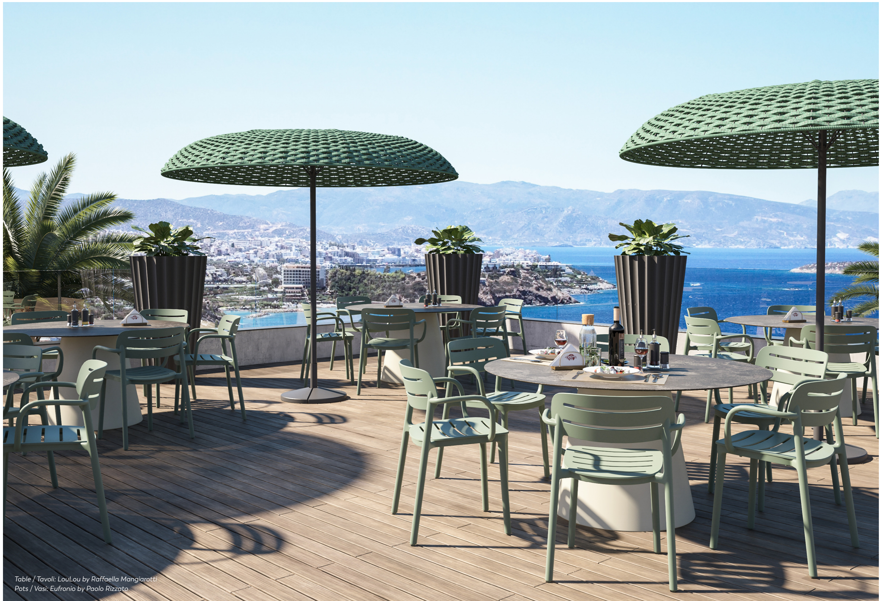
Table / Tavoli: LouLou by Raffaella Mangiarotti Pots / Vasi: Eufronio by Paolo Rizzato