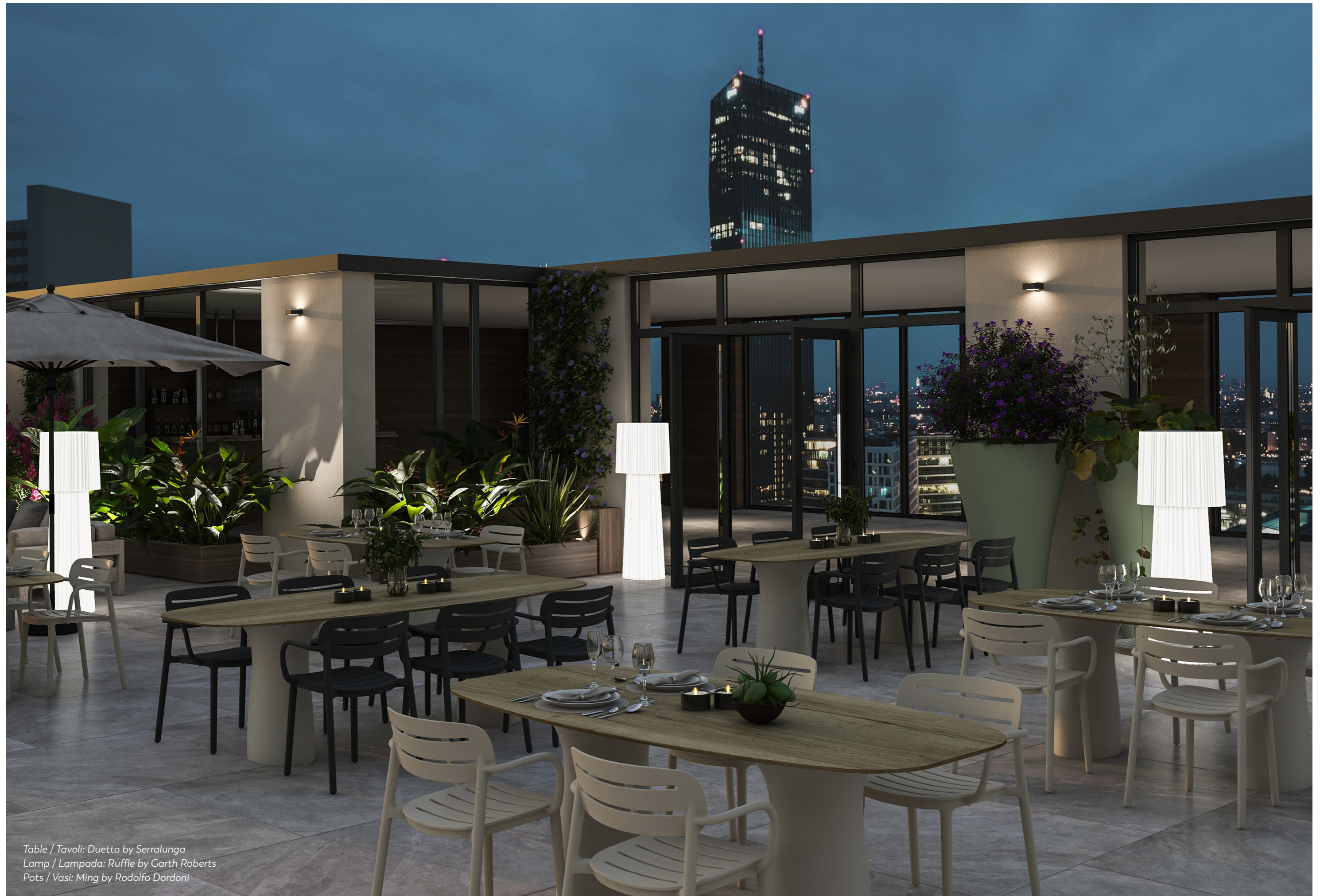
Table / Tavoli: Duetto by Serralunga Lamp / Lampada: Ruffle by Garth Roberts Pots / Vasi: Ming by Rodolfo Dordoni