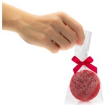
1 pz $25