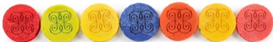
Manzana Kiwi Piña Arándano Maracuyá Mango Guayaba