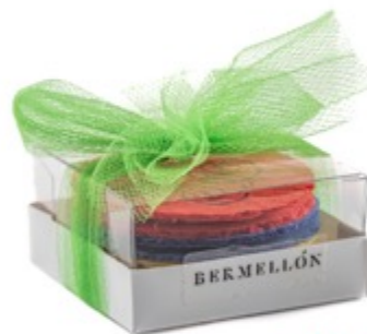
4 pz $90