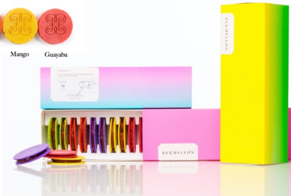
14 bermellones $280