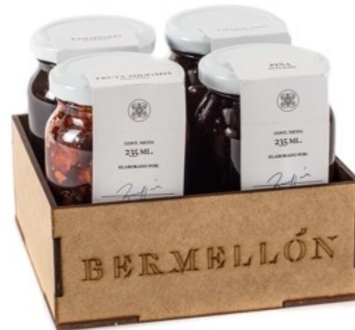
Caja con 4 jaleas