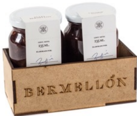
Caja con 2 jaleas