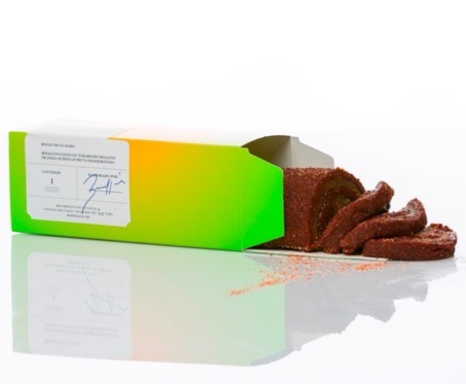
Rollo entero $260

Guayaba cubierta de Tamarindo, relleno de Jalea acidita.