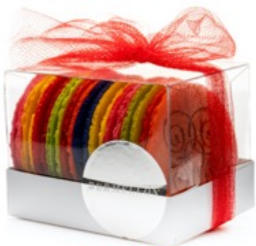
10 pz $180