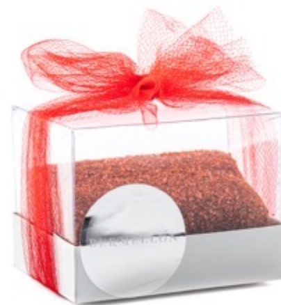
Medio rollo $140