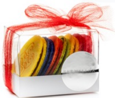
7 pz $140