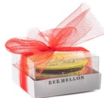
3 pz $80 2 pz $60

*Súrtela con los sabores que más te gusten.