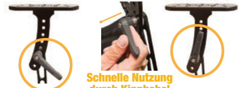
Schnelle Nutzung durch Kipphebel

Mit den Kipphebeln ist schnelle und einfache Ausrichtung möglich. Ziehen Sie einfach den Hebel und stellen Sie die neue Position ein (ohne die Schraube zu lockern oder fester zu drehen).