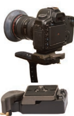
Montage mit Manfrotto RC-2