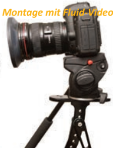
Montage mit Fluid-Videokopf

Steady Shot wurde so entworfen, dass damit zahlreiche Kamerastützsysteme wie Schnellspanner, Kugelköpfe und Videoköpfe verwendet werden können. Nutzen Sie mit Hilfe der beiliegenden 1/4 Zoll x 20 Edelstahlschraube eines der zehn möglichen Montagelöcher, um das optimale Gleichgewicht und die bequemste Haltung für Ihre Kamera zu erreichen. Vergewissern Sie sich, dass sie die Schraube mit dem Inbusschlüssel wirklich fest gezogen haben und prüfen Sie oft nach, ob sie sich gelockert hat.