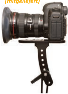
Montage mit Schraube (mitgeliefert)