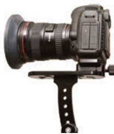
Montage mit Schnellspanner