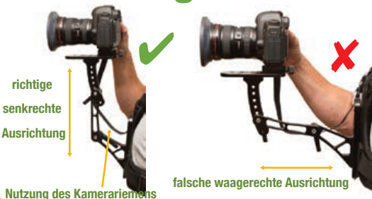
richtige senkrechte Ausrichtung