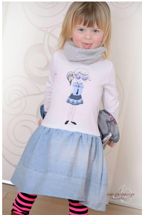
Ina von INAs-photo-Design