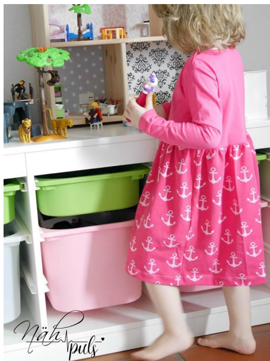
Iris von Naehpuls