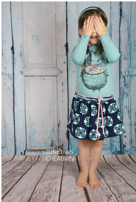
Stefanie von junebugscativity