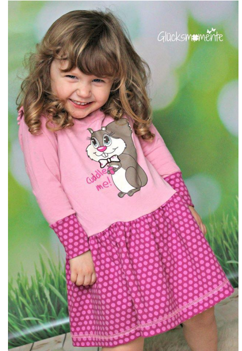
Janine von gluecksmomentebygeraja

Nutzungsrechte: Vervielfältigung und Weitergabe der Anleitung sind nicht gestattet. Alle Rechte dieser Anleitung liegen bei: Amelie&Luise by Steffi Lauer. Für Fehler in der Anleitung kann keine Haftung übernommen werden.