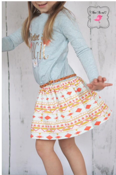
Yasemin von mimimemal2