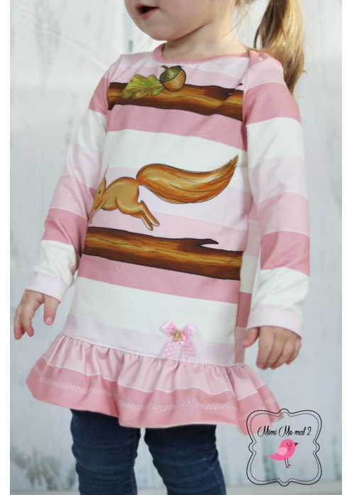
Yasemin von mimimemal2