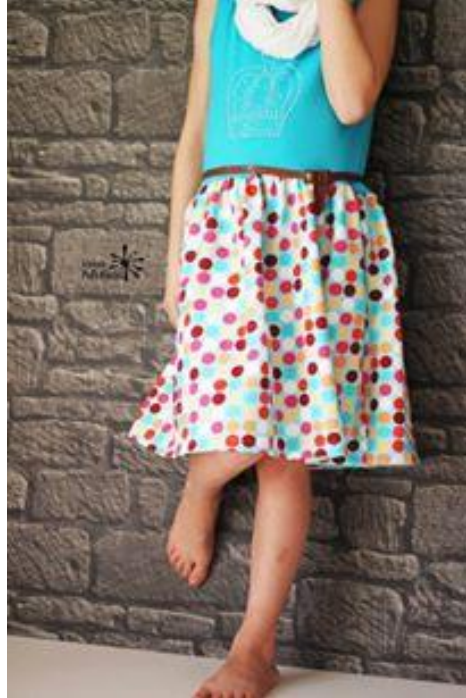
Yvonne von kleinerpolliklecks