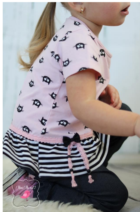
Yasemin von mimimemal2